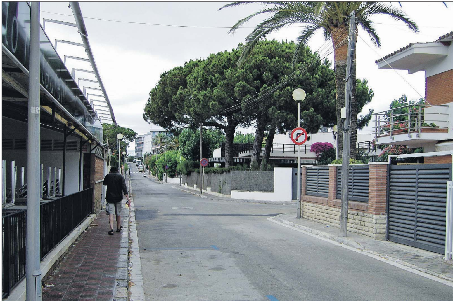
Las zonas azules no están ocupadas en esta época del año. Los residentes no-fijos creen que son caras y aparcan en otros puntos gratuitos.

CAMBRILS ■ RADIOGRAFÍA DE LOS BARRIOS Y URBANIZACIONES DE LA LOCALIDAD