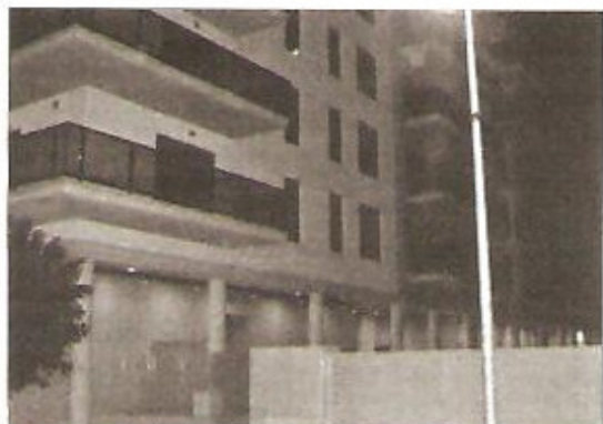
El edificio corresponde a los números 11-13 de la calle Glorieta.

El secretario general adjunto de CDC, Felip Puig, consideró ayer «premeditado» el trato a los detenidos por la operación Pretoria, que pudieron ser fotografiados esposados, y que atribuyó a una supuesta estrategia para ocultar el fracaso del Gobierno socialista. «No es casual que todo esto esté apareciendo en unos momentos en que se produce un fracaso total en el modelo de gestión socialista. Me gustaría pensar que todos estos síntomas no tienen una relación de causa-efecto, pero me da la sensación, y más cuando Rubalcaba no ha querido dar ninguna explicación ni disculpa, de que alguna relación debe haber», sugirió.