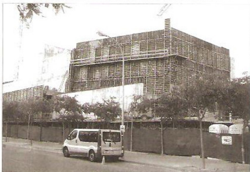
Este es el estado actual en que se encuentran las obras del Teatre Auditori de Cambrils.